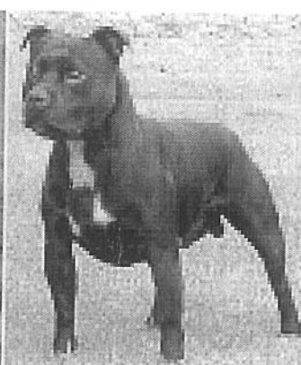
Staffordshire Bull Terrier