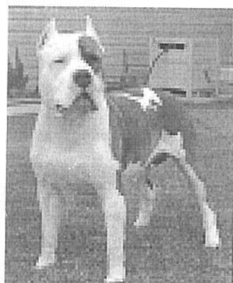
American Staffordshire Terrier